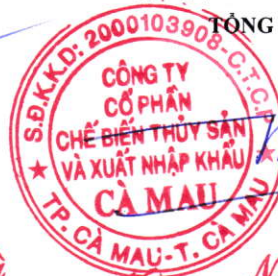
Nguyễn An Ninh