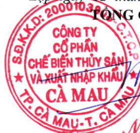
Nguyễn An Ninh